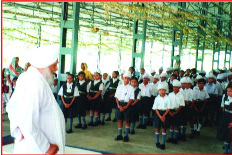
ਟਰਸਟ ਦੇ ਬਾਨੀ ਮਹਾਂਪੁਰਖ 'ਗੁਰੂ ਗੋਬਿੰਦ ਸਿੰਘ ਵਿਦਿਆ ਮੰਦਰ ਰਤਵਾੜਾ ਸਾਹਿਬ' ਦੇ ਵਿਦਿਆਰਥੀਆਂ ਨਾਲ ਬਚਨਾਂ ਦੀ ਸ਼ਾਂਤ ਪਾਉਂਦੇ ਹੋਏ।

ਗੁਰਦੁਆਰਾ ਹੁੰਦੇ। ਇਕ ਗੁਰਦੁਆਰਾ ਉਹ ਹੈ ਜੋ ਅਸੀਂ ਬਣਾਉਂਦੇ ਹਾਂ, ਇਕ ਗੁਰਦੁਆਰਾ ਸਾਨੂੰ ਗੁਰੂ ਨੇ ਦੱਸਿਆ। ਉਹ ਗੁਰਦੁਆਰਾ ਸਾਡਾ ਦਿੱਲੀ ਤੋਂ ਜਮਨਾ ਦੇ ਨਾਲ ਤੁਸੀਂ ਲਾਈਨ ਕੱਢ ਲਓ ਤੇ ਤਿੱਬਤ ਤੱਕ ਚਲੇ ਜਾਓ ਤੇ ਇਧਰ ਪਾਕਿਸਤਾਨ ਐ, ਹੇਠਾਂ ਚਲੇ ਜਾਓ ਜਾ ਕੇ ਦਿੱਲੀ ਤੋਂ ਥੱਲੇ ਹਰਿਆਣੇ ਦੇ ਮਹਿੰਦਰਗੜ੍ਹ, ਤੱਕ ਐਡਾ ਗੁਰਦੁਆਰਾ ਹੈ ਮੇਰਾ। ਮੇਰੇ ਕੋਲ ਹੈ ਕੁਦਰਤੀ ਆਫ਼ਤਾਂ ਦਾ ਮਹਿਕਮਾ। ਜੇ ਮੇਰੇ ਹੁੰਦੇ ਹੁੰਦੇ ਇਕ ਬੰਬ ਟੁੱਟ ਗਿਆ, ਇਕ ਬੰਬਾ ਰੁੜ੍ਹ ਗਿਆ, ਖੇਤੀ ਚਲੀ ਗਈ, ਪਸ਼ੂ ਰੁੜ੍ਹ ਗਏ, ਮੇਰਾ ਜਪੁਜੀ ਸਾਹਿਬ ਕੀ ਕਰੂਗਾ, ਮੇਰਾ ਭਜਨ ਕਰਨਾ ਕੀ ਕਰੂਗਾ ਤੇ ਮੇਰਾ ਭਜਨ ਹੁਣ ਇਹੀ ਹੈ ਕਿ ਮੈਂ ਤੜਕੇ ਚਾਰ ਵਜੇ ਲੱਗ ਜਾਨਾਂ, ਰਾਤ ਦੇ ਗਿਆਰ੍ਹਾਂ ਵਜੇ ਜਦ ਜਾਂਦਾ, ਜਦ ਮੈਨੂੰ ਤਸੱਲੀ ਹੋ ਜਾਂਦੀ ਹੈ ਕਿ ਐਸ ਵੇਲੇ ਸਭ ਠੀਕ ਹੈ। ਹੈਰਾਨ ਹੋ ਗਿਆ ਕਹਿਣ ਲੱਗਿਆ ਕਿ ਤੂੰ ਐਡੀ ਵੱਡੀ ਸੋਚ ਰਖਦੈ? ਮੈਂ ਕਿਹਾ ਹਾਂ ਮੇਰੇ ਗੁਰੂ ਨੇ ਦੱਸਿਆ ਕਿ -