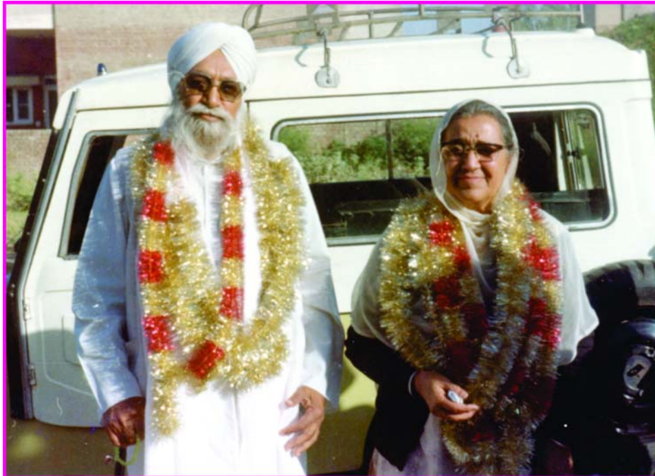
ਸੰਤ ਮਹਾਰਾਜ ਅਤੇ ਸੰਤ ਮਾਤਾ ਜੀ 'ਅਭੁੱਲ ਯਾਦ'

ਜਦੋਂ ਮਹਾਰਾਜ ਜੀ ਦੇ ਕੋਲ ਗਿਆ ਉਨ੍ਹਾਂ ਨੇ ਇਕ ਸਕਿੰਟ ਵਿਚ ਦੇਖ ਲਈ ਗੱਲਬਾਤ ਸਾਰੀ। ਕਹਿਣ ਲੱਗੇ, “ਤੂੰ ਕੌਣ ਹੈਂ?” ਆਹ ਗੱਲ ਸੁਣ ਕੇ ਮੈਂ ਚੁੱਪ ਕਰ ਗਿਆ, ਇਕ ਮਿੰਟ ਖੜ੍ਹਾ ਰਿਹਾ, ਸੰਗਤ ਬੋਲੀ ਜਾਵੇ। ਕਹਿਣ ਕਿ ਕਾਕਾ ਤੈਨੂੰ ਪੁੱਛਿਐ ਕਿ ਤੂੰ ਕੌਣ ਹੈਂ? ਮਹਾਰਾਜ ਕਹਿੰਦੇ, “ਤੂੰ ਦੱਸਿਆ ਨਹੀਂ?” ਮੈਂ ਕਿਹਾ, “ਦੱਸਦਾ ਜੀ।” ਇਕ ਮਿੰਟ ਫੇਰ ਲੰਘ ਗਿਆ। ਕਾਫੀ ਸਮਾਂ ਹੁੰਦੇ ਜੇ ਇਕ ਮਿੰਟ ਕੋਈ ਖੜ੍ਹਾ ਰਹੇ। ਉਸ ਤੋਂ ਬਾਅਦ ਤੀਸਰਾ ਮਿੰਟ ਆ ਗਿਆ। ਜਦ ਮਹਾਰਾਜ ਜੀ ਨੇ ਕਿਹਾ ਕਿ ਦੱਸਿਆ ਨਹੀਂ, ਸੰਗਤ ਹੱਸ ਪਈ ਕਿ ਲੈ ਮੁੰਡੇ ਨੂੰ ਦੱਸਣਾ ਨਹੀਂ ਆਉਂਦਾ। ਮਹਾਰਾਜ ਜੀ ਕਹਿੰਦੇ, “ਖਾਮੋਸ਼।” ਤੁਹਾਨੂੰ ਨਹੀਂ ਪਤਾ ਕਿ ਕੀ ਗੱਲ ਹੋ ਰਹੀ ਹੈ। ਦੱਸਵੀਂ ਪਾਸ ਕਰਕੇ ਮੈਨੂੰ ਥੋੜ੍ਹੀ ਦੇਰ ਹੋਈ ਸੀ ਅਵਾਰਾ ਘੁੰਮਦੇ ਨੂੰ। ਅਵਾਰਾ ਇਸ ਤਰ੍ਹਾਂ ਸੀ ਮੈਂ ਚਲਿਆ ਜਾਂਦਾ ਸੀ ਜਿਥੇ ਜੀਅ ਕਰਦਾ ਸੀ, ਜਿਥੇ ਜੀਅ ਕਰਿਆ ਰਹਿ ਪੈਂਦਾ ਸੀ ਕੋਈ ਮੈਨੂੰ ਰੋਕਦਾ ਨਹੀਂ ਸੀ। ਰਹਿੰਦਾ ਮੈਂ ਗੁਰਦੁਆਰਿਆਂ 'ਚ ਹੀ ਹੁੰਦਾ ਜਾਂ ਕਿਸੇ ਸਾਧੂ ਕੋਲ ਰਹਿੰਦਾ ਹੁੰਦਾ, ਕੀਰਤਨ ਸੁਣਦਾ ਹੁੰਦਾ ਜਾਂ ਭਜਨ ਕਰੀ ਜਾਂਦਾ ਸੀ ਕਿਤੇ ਬੈਠਾ। ਮੈਨੂੰ ਕੋਈ ਐਸਾ ਸਾਧੂ ਨਹੀਂ ਸੀ ਮਿਲਿਆ ਜਿਸਨੂੰ ਮੈਂ ਪੂਰੇ ਦਿਲ ਨਾਲ ਆਪਣਾ ਆਪ ਸੌਂਪ ਦੇਵਾਂ। ਕਿਉਂਕਿ ਮੇਰੇ ਅੰਦਰ ਤਰਕ ਸੀ, ਪਰਖ ਸੀ, ਕਿ ਸਾਧੂ ਕਿਹੋ ਜਿਹਾ ਹੁੰਦਾ ਹੈ। ਮੇਰਾ ਨਾਮਧਾਰੀ ਸੰਤਾਂ ਦੇ ਨਾਲ ਬਹੁਤ ਵਾਹ ਰਿਹਾ, ਨਾਮਧਾਰੀਆਂ ਦੇ ਸੰਤ ਤਾਂ ਬਹੁਤ ਨਾਮ ਜਪਦੇ ਸੀ, ਸੱਚਮੁਚੀਂ ਜਪਦੇ ਸੀ। ਉਨ੍ਹਾਂ ਦਾ ਵੀ ਅਸਰ ਮੇਰੇ ਤੇ ਸੀਗਾ। ਮਹਾਰਾਜ ਕੋਲੋਂ ਪੁੱਛਣ ਵਾਲੀ ਗੱਲ ਨਹੀਂ ਸੀ ਮੇਰੇ ਕੋਲ ਕਿ ਕੀ ਪੁੱਛਿਆ ਜਾਵੇ। ਮਹਾਰਾਜ ਜੀ ਨੇ ਸਵਾਲ ਕਰ ਦਿਤਾ। ਤਿੰਨ ਮਿੰਟ ਲੰਘ ਗਏ ਮਹਾਰਾਜ ਜੀ ਕਹਿੰਦੇ ਦਸਦਾ ਨਹੀਂ। ਮੈਂ ਕਿਹਾ ਜੀ ਮੈਨੂੰ ਦੱਸਣਾ ਨਹੀਂ ਆਉਂਦਾ। ਉਨ੍ਹਾਂ ਨੂੰ ਪਤਾ ਲਗ ਗਿਆ, ਕਹਿੰਦੇ ਅੱਛਾ ਦੱਸ ਕਿਵੇਂ ਨਹੀਂ ਦੱਸਣਾ ਆਉਂਦਾ? ਤੁਸੀਂ ਹੈਰਾਨ ਹੋਓਗੇ ਇਹ ਕੋਈ ਸਿਆਣੇ ਬੰਦੇ ਦੀਆਂ ਗੱਲਾਂ ਨਹੀਂ ਹਨ? ਇਹ ਕਮਲੇ ਬੰਦਿਆਂ ਦੀ ਬਾਤਾਂ ਨੇ, ਮੈਂ ਤਾਂ ਹੀ ਕਹਿੰਦਾ ਕਿ ਮੈਨੂੰ ਅਕਲ ਨਹੀਂ ਹੈ, ਸੰਸਾਰ ਦੀ। ਪਤਾ ਹੀ ਨਹੀਂ ਹੈ ਕਿ ਇਥੇ ਮੇਰਾ ਨੁਕਸਾਨ ਹੋ