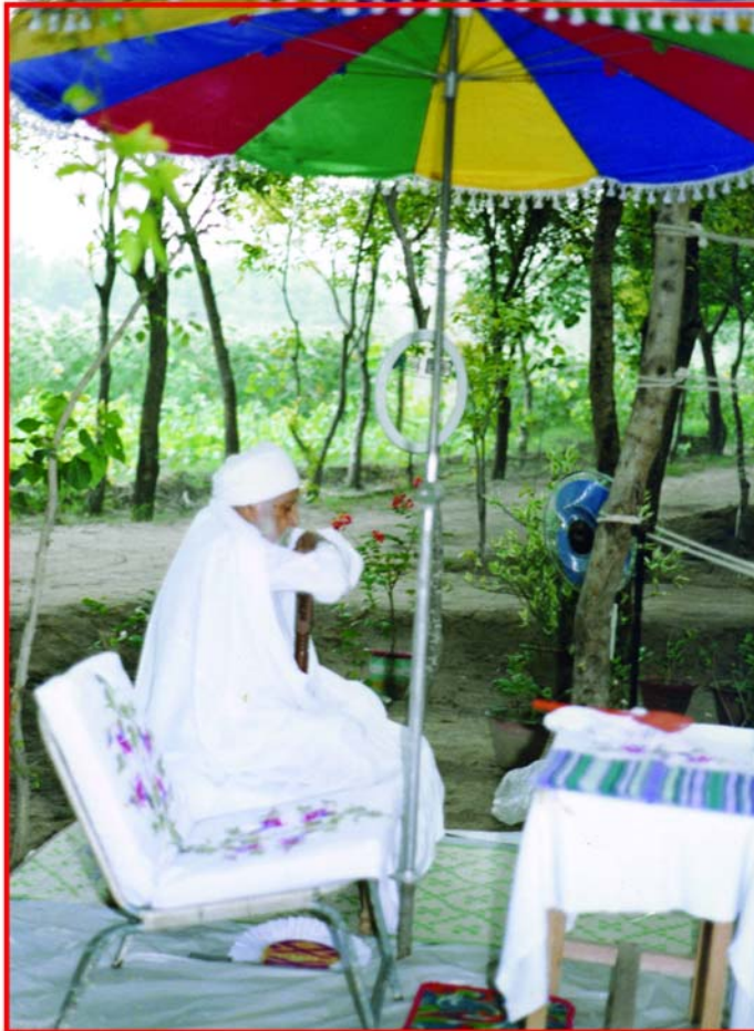
ਸੰਤ ਮਹਾਰਾਜ ਜੀ ਰਤਵਾੜਾ ਸਾਹਿਬ ਤਪੋ ਅਸਥਾਨ ਵਿਖੇ ਸਮਾਧੀ ਅਸਥਿਤ

ਉਸ ਤੋਂ ਬਾਅਦ ਮੈਂ ਪਿੰਡ ਆਇਆ, ਪਿੰਡ ਵੀ ਓਹੀ ਕੰਮ ਸ਼ੁਰੂ ਕਰ ਲਿਆ। ਜਦੋਂ ਮੈਂ ਨੌਕਰੀ ਕਰੀ ਫੌਜ ਵਿਚ ਉਥੇ ਵੀ ਇਹੀ ਕੰਮ ਕਰਦਾ ਰਿਹਾ। ਜਦੋਂ ਮੈਂ ਸਿਵਲ 'ਚ ਆ ਗਿਆ, ਸੈਕਟਰੀਏਟ 1957 ਵਿਚ, ਪਹਿਲਾਂ