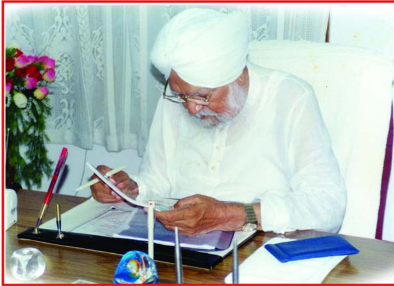
ਸੰਤ ਜੀ ਮਹਾਰਾਜ ਦਫਤਰ 'ਆਤਮ ਮਾਰਗ' ਵਿੱਚ 'ਅਭੁੱਲ ਯਾਦ ਵਿੱਚ

ਕੀਤੀਆਂ, ਗੁੱਸੇ ਵੀ ਹੋਇਆ ਮਹਾਰਾਜ ਜੀ ਨਾਲ, ਪਰ ਉਨ੍ਹਾਂ ਨੇ ਨਹੀਂ ਮੈਨੂੰ ਛੱਡਿਆ, ਫੇਰ ਸੰਭਾਲ ਲੈਂਦੇ ਸੀ।